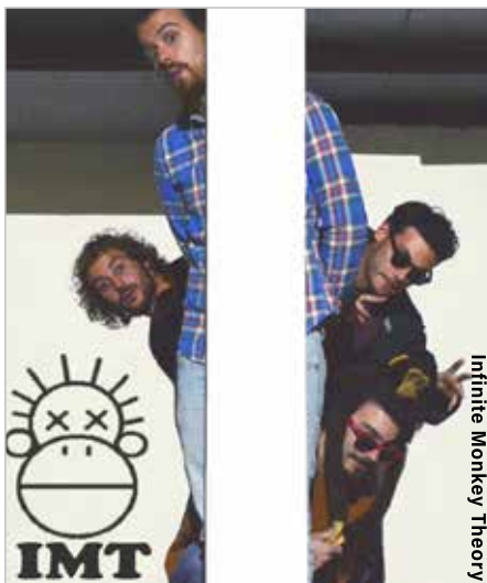
Infinite Monkey Theory