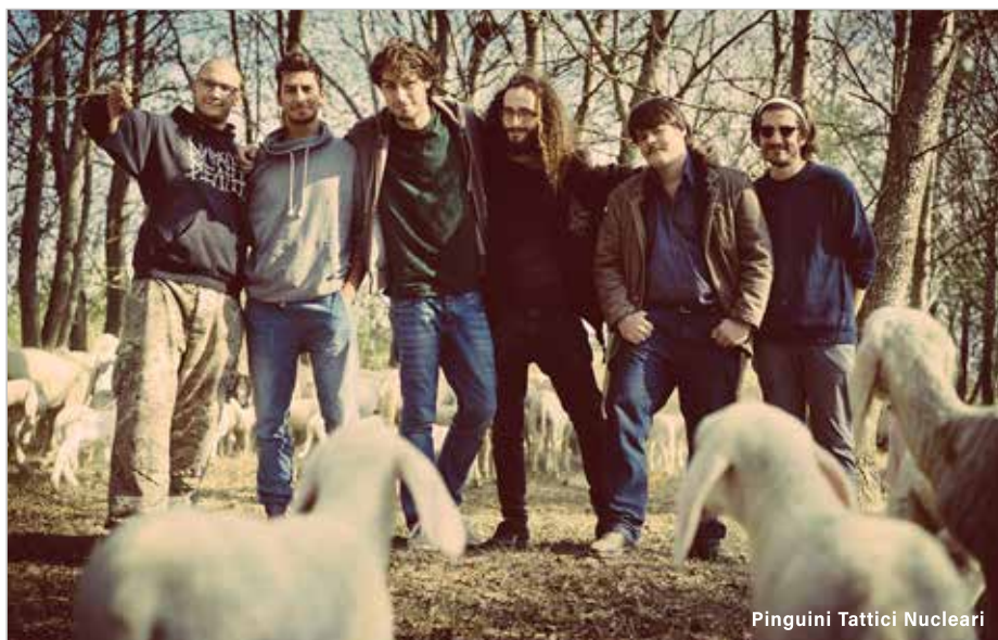
Pinguini Tattici Nucleari

Giovedì 5 e venerdì 6 luglio musica protagonista con dieci band divise in quattro palchi