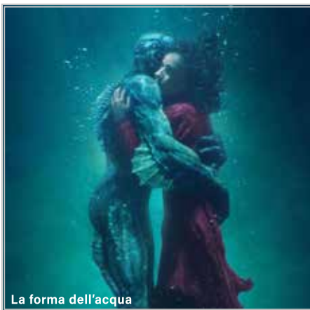
La forma dell'acqua

I film saranno proiettati alle 21.30 per un mese, dal 19 luglio al 19 agosto , dal giovedì alla domenica.