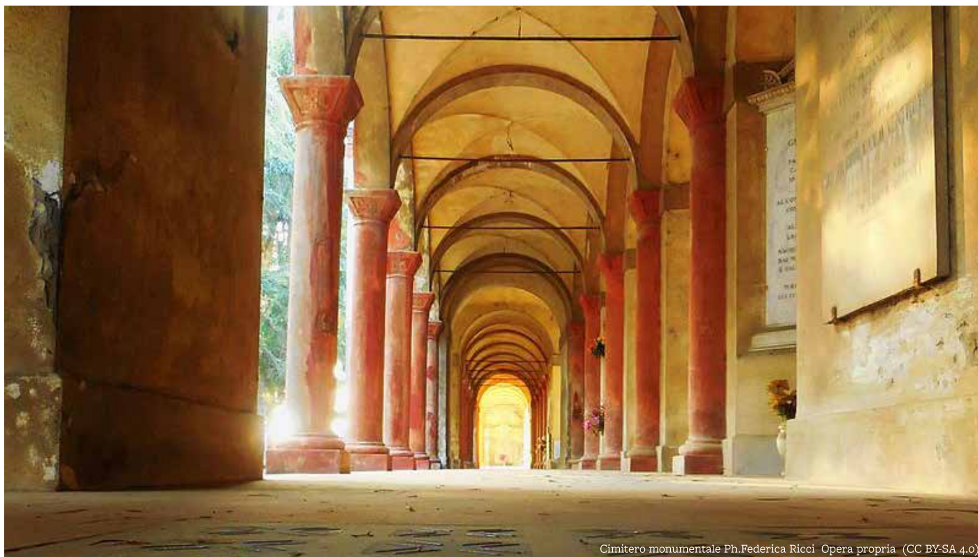
Cimitero monumentale

Contest internazionale dedicato alle fotografie