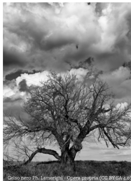
Gelso nero

e universale grazie alla loro circolazione in rete con licenza di Creative Commons. A Massa Lombarda, novità di quest'anno, al termine del concorso saranno selezionati gli scatti più belli e rappresentativi dei monumenti della città, che saranno esposti in una mostra dedicata. Una volta scelto il monumento e scattata la foto, è possibile caricarla seguendo le istruzioni illustrate al link https://wikilovesmonuments.wikimedia.it/concorso-fotografico-wlm/ . L'elenco dei luoghi candidati per il comune di Massa Lombarda è disponibile al link https://it.wikipedia.org/wiki/Progetto:Wiki_Loves_Monuments_2019/Monumenti/Emilia-Romagna/Provincia_di_Ravenna . Per ulteriori informazioni, contattare l'ufficio Cultura del Comune di Massa Lombarda scrivere a cultura@comune.massalombarda.ra.it , oppure consultare il sito http://wikilovesmonuments.wikimedia.it .